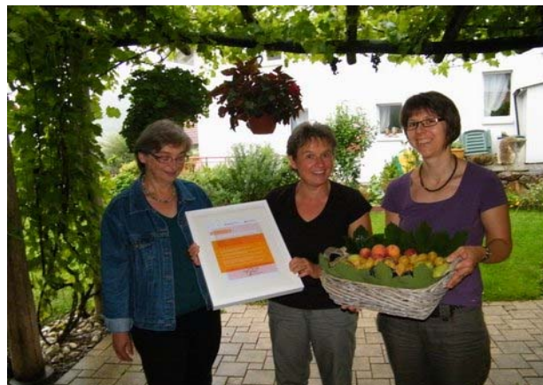
Übergabe der Auszeichnung

Weitere Informationen: www.schnitzunddrunder.bl.ch unter der Rubrik ‚Auszeichnungen‘